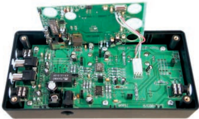
3 - En ôtant la première platine, on découvre le reste de l'électronique.

dans tous les sens le sélecteur de niveau en pensant qu'il n'agit pas, écoutez attentivement pendant quelques secondes ! Il est intéressant de noter l'efficacité de la réduction du bruit sur une émission non squelchée. Ainsi, l'écoute des bandes aviation apparaît moins fatigante si l'on ne peut fermer le squelch pour écouter une station faible: le bruit de fond est réduit alors que le signal de la station faible passe toujours.