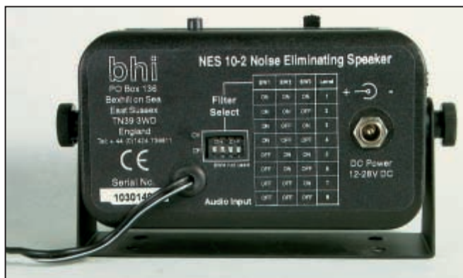
5 - Le réglage du niveau de réduction se fait à l'aide d'un DIP-switch.

noter la disparition du petit bruit lié à l'alternateur, présent lorsque j'écoute des stations AM (aviation). Il existe un modèle simplifié: le NES CB sur lequel le niveau de réduction du bruit est fixe. Ce der-