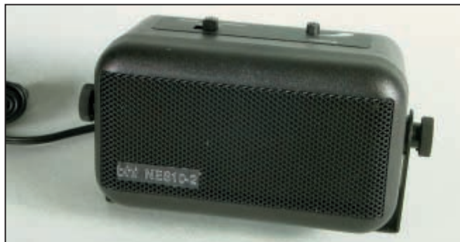
4 - Un petit haut-parleur supplémentaire presque banal.

Le NES10-2 peut, bien entendu, être utilisé en fixe comme en mobile et saura même s'avérer utile pour des professionnels. Sur mon véhicule, j'ai pu